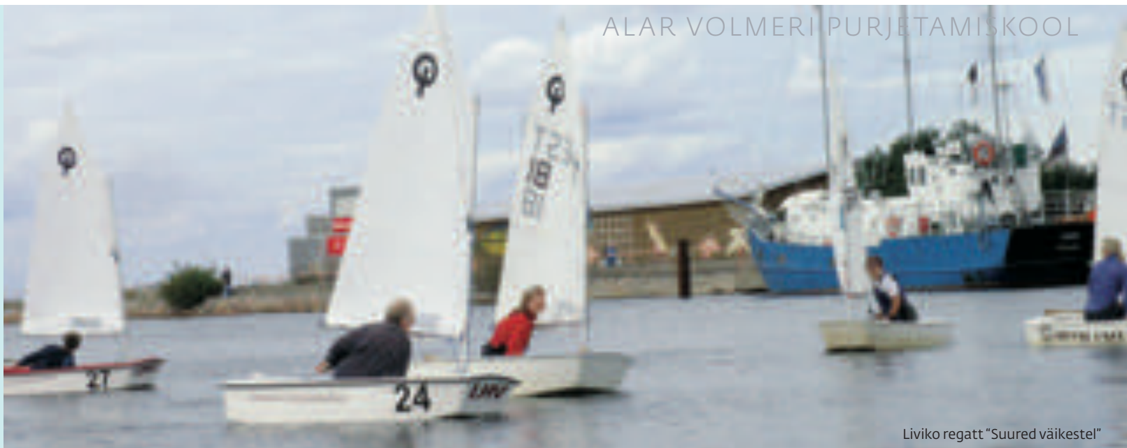
Liviko regatt "Suured väikestel"

ülevaate olukorrast ja ohtudest. Tegin seda ja hoiatasin, et jahti kontrolli alla hoida on äärmiselt raske. Hüva, mees asus roolima ja paari minuti pärast kommenteeris, et pole hullu. Mõtle sin, et ilmselt olen liiga ettevaatlik ja tundsin oma pelgikkuse üle isegi veidi häbi. Lahkusin tekilt, viskasin tormikad seljast, sõin kõhu täis ja olin parasjagu magamiskotti pugemas, kui kontroll jahi üle kadus.